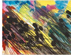
Stanley Wiliam Hayter

Stwórz dwie proste kompozycje – statyczną i dynamiczną. Technika dowolna.