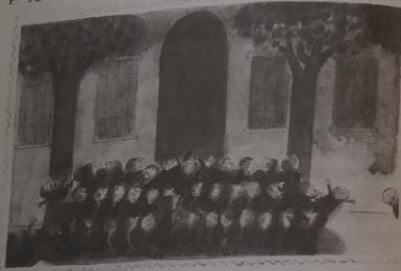
Od góry, od lewej: Martin (poruszył się), Poulot, Dubéda, Coussignon, Rufus, Aldebert, Euzebiusz, Champignac, Lefèvre, Toussaint, Chartier, Sarigaut. W środku: Paul Bojojof, Jacques Bojojof, Marquou, LaFontan, Lebrun, Dubos, Delmont, de Fantagnès, Martineau, Gotfryd, Mespoulet, Falot, Lafageon. Siedzą: Rignon, Guyot, Hannibal, Croutsef, Bergès, nasza pani, Ananiasz, Mikołaj, Fari- bol, Grosini, Gonzales, Pichenet, Alcest i Mouchevin (którego potem wydalone).

zaczął płakać i krzyczeć, że nic nie widzi, że nikt go nie lubi i że chce umrzeć. Pani go pocieszała, wytarła mu nos, przyglądała włosy i ukarała Alcesta. Miał napisać sto razy: